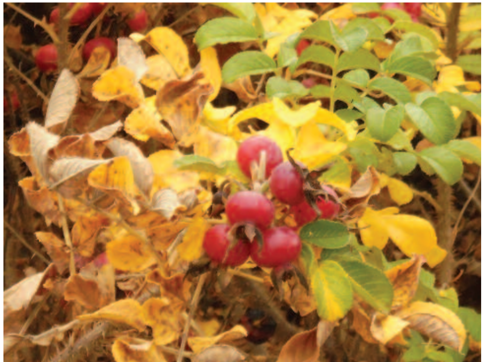
Kopogtatás nélkül benyit a kilencedik hónap

A „Természet” kifejezés eleinte az egész világot jelölte. Ekkor még nem különböztet-