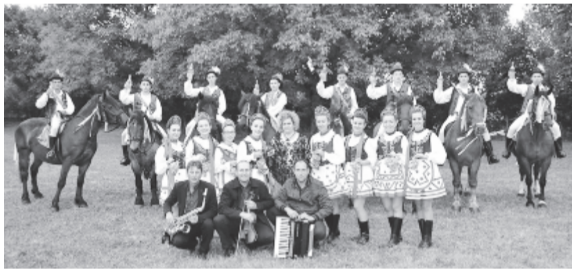
A remetei fiatalok is fenntartják a hagyományt, megkóstol(tat)ják a szőlőt és a bort

A szüreti bálok időszeke már két hete megkezdődött vidéken, a remeteiek mellett az andrásfalvi fiatalok is bált rendeztek, az előttük álló hétvégén Erdőszentgyörgyön, Küsmődön, Székelyberében lehet táncra perdülni, egy hétre rá Nyáradszentmártonban, szeptember utolsó szombatján pedig Nyáradgálfalván rendeznek szüreti bált, táncmulatságot.