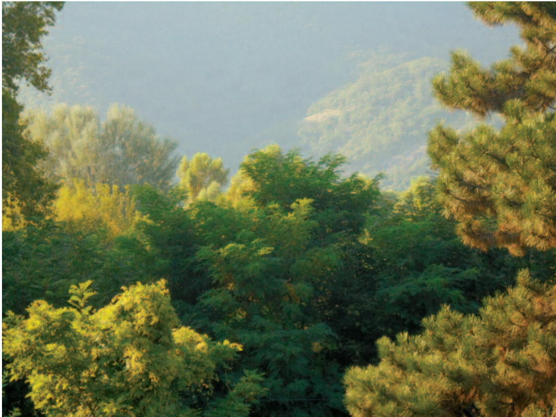
Reggelenként apró ködfióka s pára kapaszkodik föl a part menti fákra

Lenn a gát alatt csak vadrécek, vadludak. Ők is búcsúzóban: tiszteletkört úsznak.